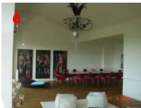
Esstisch, Stühle, Fellhocker, Teppich und Leuchter bleiben.